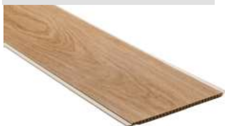
Forro Decor Carvalho