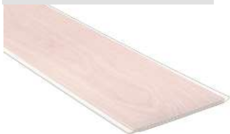
Forro Decor Pátina