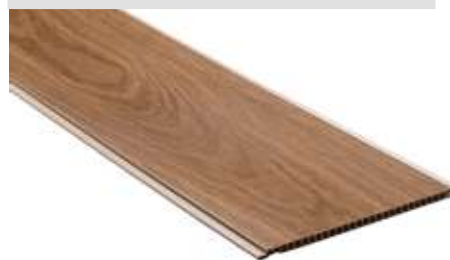
Forro Decor Nogueira